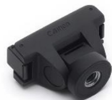
Soporte adaptador de liberación rápida ajustable para Osmo