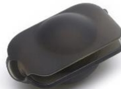
Protector de lente de goma para Osmo 360