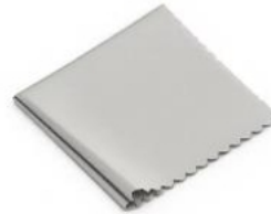
Paño de limpieza para lentes Osmo