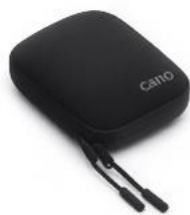
Bolsa protectora para cámara Osmo 360