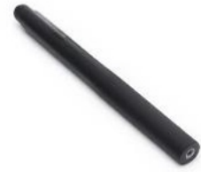
Palo de selfie invisible Osmo de 1.2 m