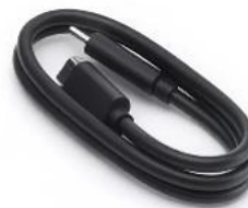
Cable USB-C a USB-C PD (USB 3.1)