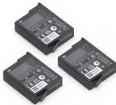
Batería Osmo Action Extreme Plus (1950 mAh)