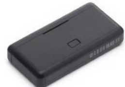
Estuche de batería multifuncional Osmo Action 2